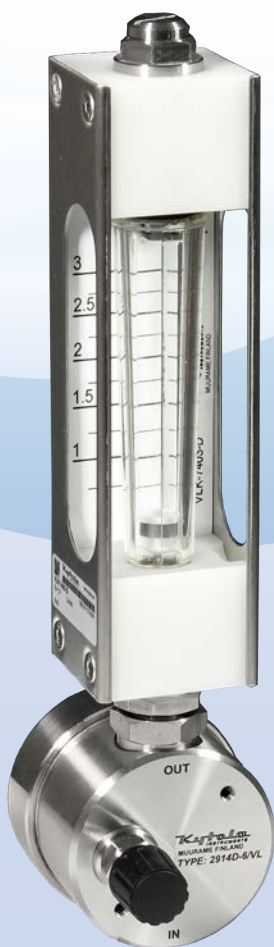
Modell 2914 mit Durchflussmesser-Modell VL

Das Modell 2914 wurde konzipiert, um in Anwendungen mit schwankendem Versorgungs- oder Gegendruck für einen konstanten Durchfluss von mittelgrossen Flüssigkeitsmengen zu sorgen.